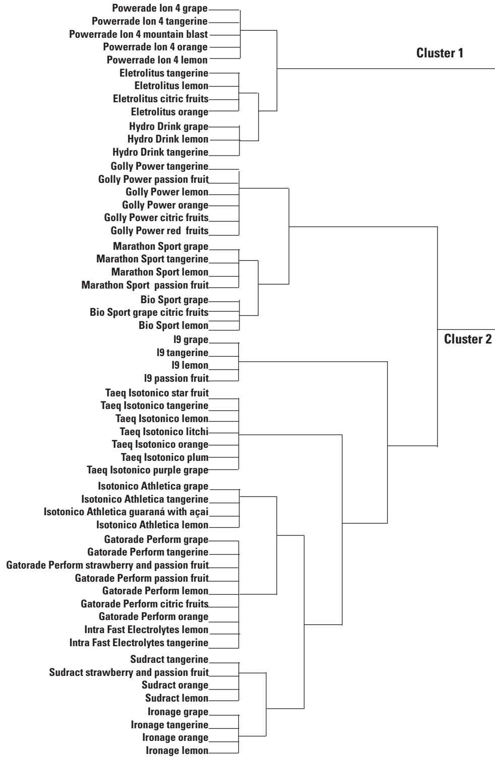
Figure 1 – Dendrogram of cluster analysis of Hydroelectrolytic Supplements. São Paulo, 2017.